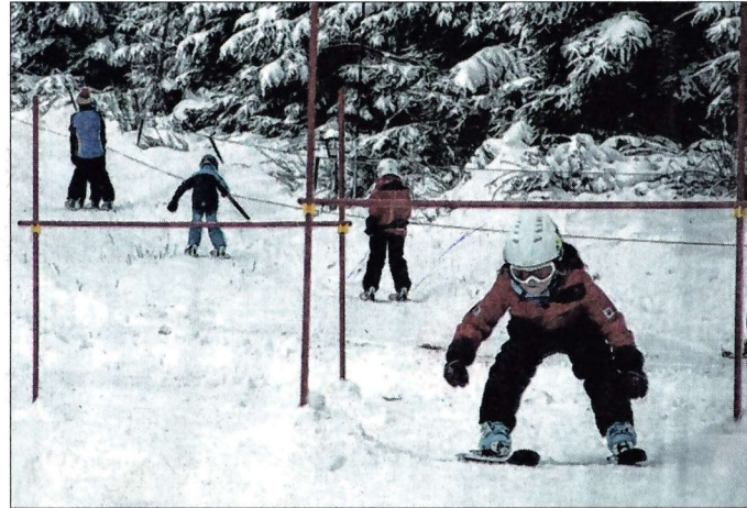
Einige Mädchen und Jungen versuchten sich am alpinen Skisport. Die Verantwortlichen vom SCR sichteten so manches Talent.