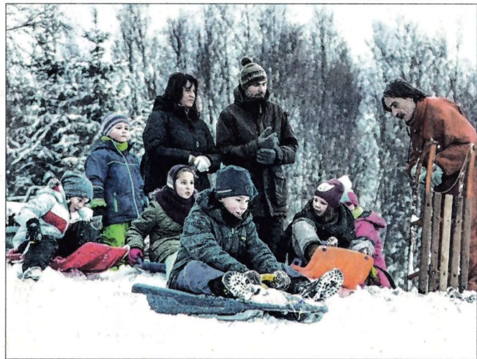
Am Mittwochmorgen ging es für die Feudinger Grundschüler in den Rückershäuser Schnee statt ins Klassenzimmer.