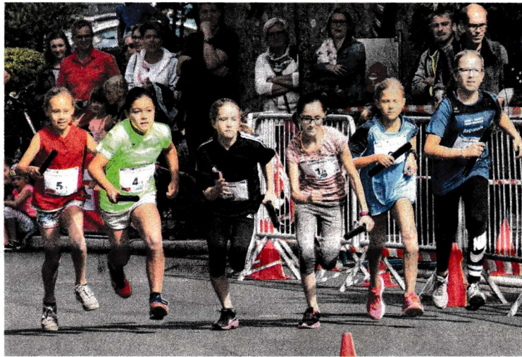
Große Motivation bei den Kindern, großes Interesse bei den Zuschauern: Der Schulstaffellauf (im Foto die Grundschulen) hat sich bewährt.

Er ist eigentlich auf der Bahn unterwegs, lief die 5000 Meter kürzlich unter 15 Minuten und will