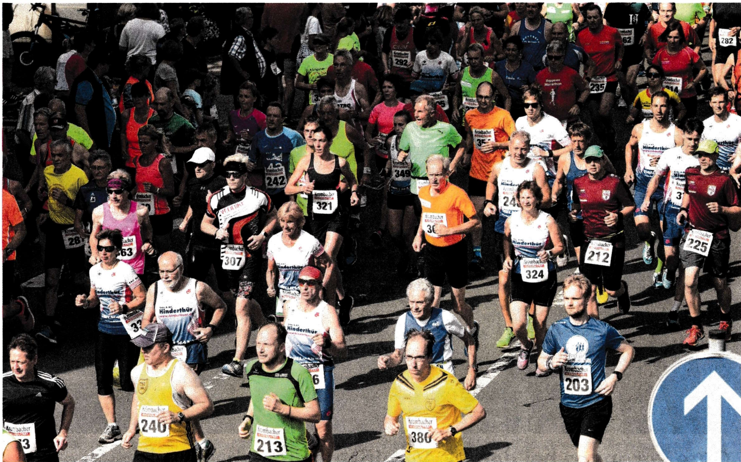
Alle Farben und alle Altersklassen vertreten: Das Feld beim Bad Berleburger Citylauf nach dem Startschuss zum Hauptlauf über 10 Kilometer.